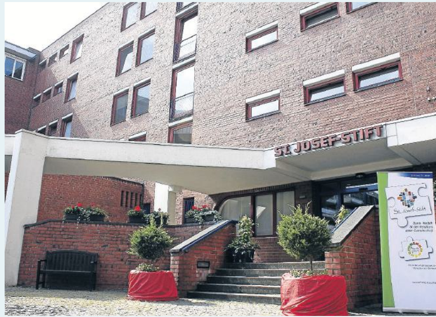
Zentral gelegen und doch im Grünen – so präsentiert sich das St. Josef-Stift seit 50 Jahren im Herzen von Emsdetten. Hier sind die Bewohnerinnen und Bewohner mitten im Leben und haben eine grüne Oase mit viel Verweilqualität direkt im Innenhof.

Heute arbeiten 28 Nationen unter dem Dach des Stifts gemeinsam für die ältere Generation. Diese Vielfalt ist kein Nebenaspekt – sie ist zu einem festen Bestandteil der Identität des Hauses geworden. Pflege ist und bleibt eine zutiefst menschliche Aufgabe. Im St. Josef-Stift wird sie in vielen Sprachen gesprochen – aber immer mit derselben Haltung: mit Respekt, Engagement und Herz.