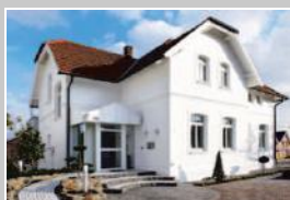
Haus des Abschieds, Nordwalder Str. 66, Emsdetten

Emsdettener Beerdigungs-Institut • seit 1948