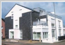
Schulte-Austum KG, Büro, Nordwalder Str. 64, Emsdetten