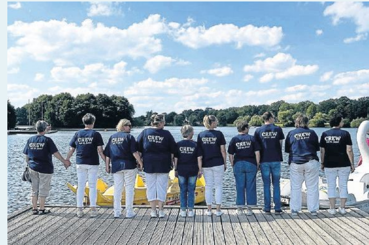
Das Team des Sozialen Dienstes im St. Josef Stift unterstützt die Bewohnerinnen und Bewohner auf vielfältige Weise - wie etwa hier bei einem gemeinsamen Ausflug.

Reinigungskräfte leisten einen unverzichtbaren Beitrag für das Wohlbefinden aller Bewohnerinnen und Bewohner. Sie arbeiten oft im Hintergrund, doch ihre Leistung ist eine zentrale Grundlage dafür, dass der Alltag im Pflegeheim reibungslos und würdevoll abläuft.